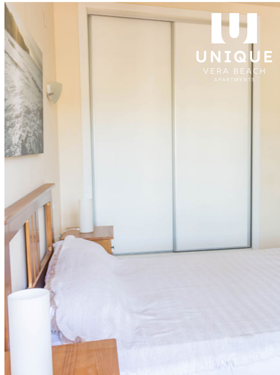
DORMITORIO · BEDROOM