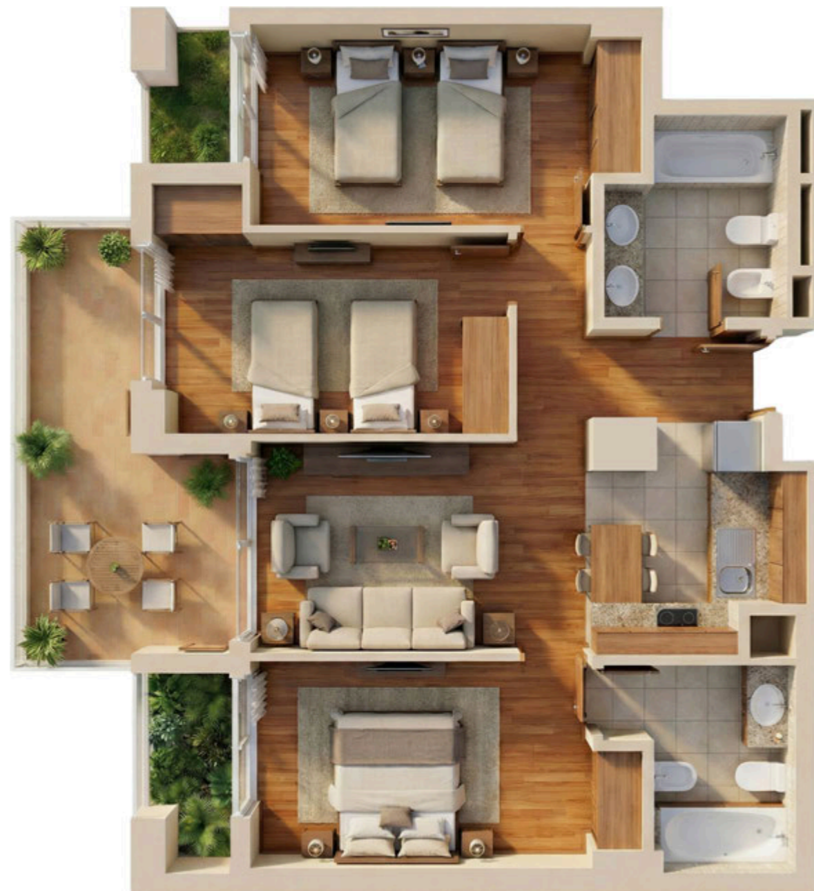
APARTAMENTO TIPO 6 (6 PLAZAS) · TYPE 6 APARTMENT (6 PEOPLE)